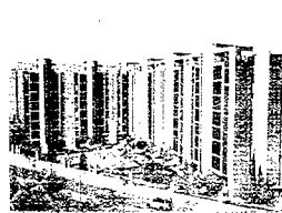
Alameda de Osuna. Edificio Galeón