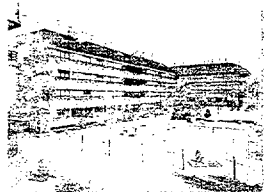
Majadahonda. Residencial Vallengaro