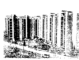
Alameda de Osuna. Edificio Galeón